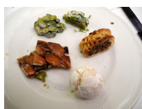
Grappa di Moscato

Prodotta da un vitigno autoctono molto diffuso nelle regioni del Trentino Alto Agide e Friuli Venezia Giulia, ha mostrato sin da subito una buona complessità, iniziando con un intenso profumo di uva passa, poi virato verso i toni più freschi di pera e mela golden. Con questa grappa, il Maestro Cappello ha preparato un piccolo tour con tre delle sue straordinarie mousses: ai frutti di bosco, al pistacchio e al cardamomo. Classiche e di grande esecuzione la prima e la seconda, ma assolutamente magistrale la terza, infatti in essa non era presente solo il cardamomo, bensì anche una parte al caffè ed una al limone. Conosco bene la mousse al cardamomo di Salvatore , ha infatti allietato un mio compleanno, ma ciò che mi ha lasciato più sorpreso di questo dolce è stato il sapiente equilibrio creato con tre sapori molto difficili da dosare e da far parlare tra di loro.