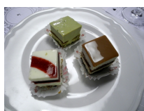
Grappa di Teroldego