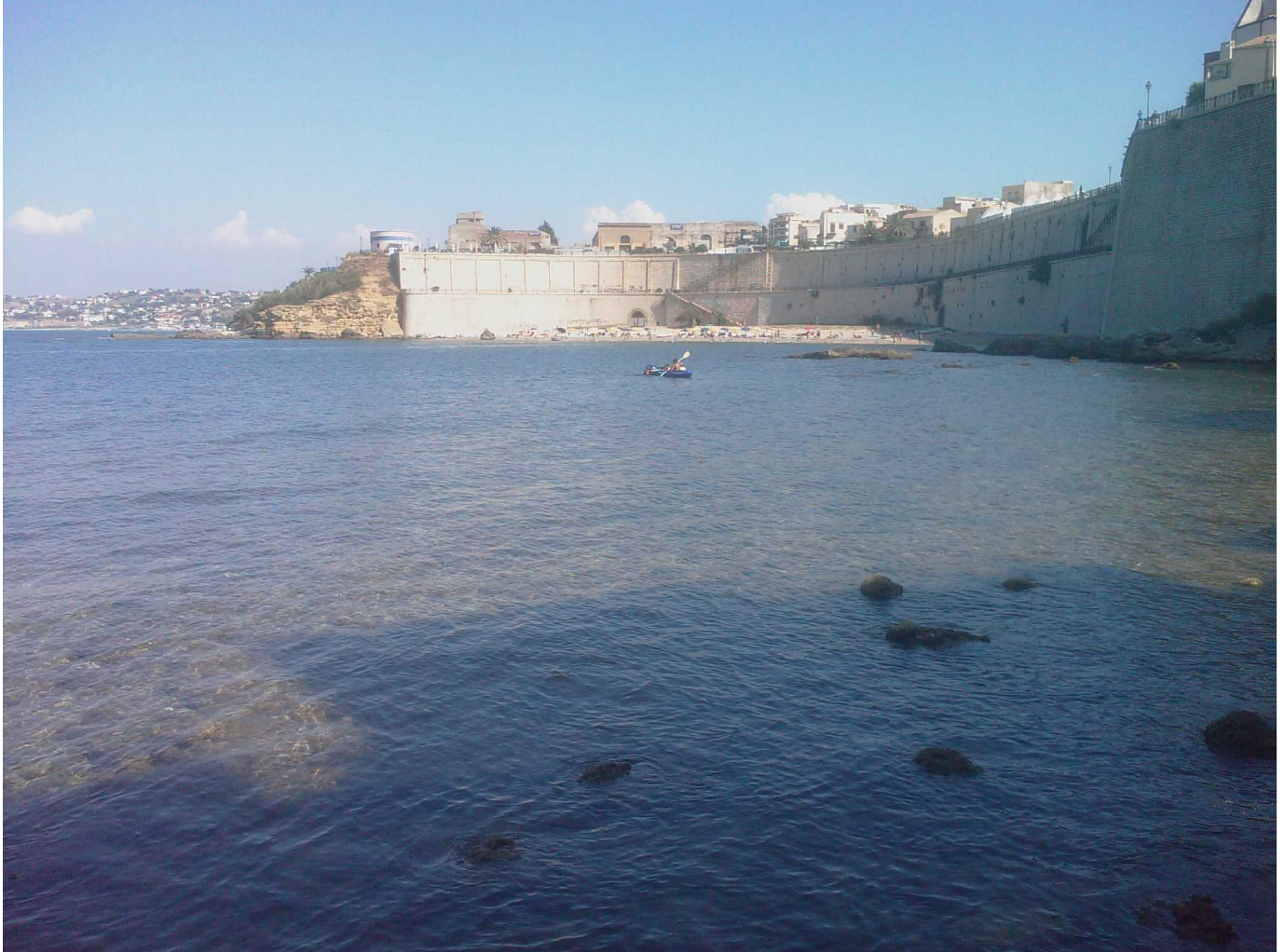
La spiaggia di Castellammare del Golfo

Grande affluenza di pubblico per la prima edizione della manifestazione "Di Pane in Pasta" tenutasi nei giorni dell'8 e 9 Agosto 2009.